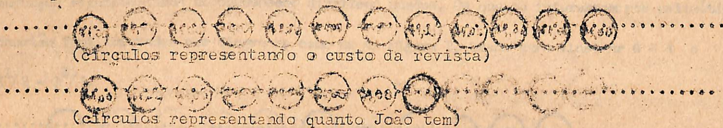
Fig. 1 - Maneira de agir operacional para resolver o problema de subtração do tipo "quantos sobraram"?

Considere outro exemplo: - "João quer comprar uma revista que custa Cr.$14,00. Ele tem Cr.$8,00. Quanto dinheiro mais ele precisa?" Na figura 1 vemos mais ou menos a maneira de agir inicial que manda a aritmética operacional. Note que uma coleção de 12 é comparado com uma coleção de 8. A criança tem a experiência de comparar as 2 coleções, como na ilustração. Eventualmente, ele pode visualizar esta comparação e vê que pode ser resolvida pela redução à situação subtrativa de "quantos sobraram"?