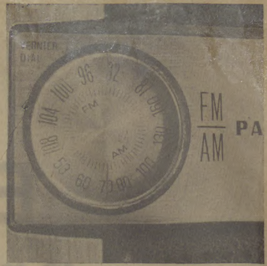
Rádios portáteis com AM e FM já estão se tornando comuns

As emissoras em FM apresentam músicas clássicas ou semi-clássicas ao longo de sua programação, e também música suave, sintonizada em restaurantes, hotéis, escritórios e casas comerciais — na filosofia de alcançar o ouvinte tanto no seu lazer, compras como no trabalho. Já a Rádio Gaúcha foge um pouco a este tipo de programação, pois procura atingir públicos variados. Apresenta desde a música erudita até a música pop. Segundo pesquisas recentes do IPOBE (Instituto Brasileiro de Opinião Pública e Estatística) das emissoras da capital, a Rádio Gaúcha é que tem os maiores índices de audiência.