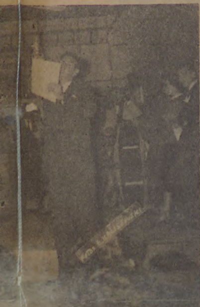
Nos bons tempos do rádio, a comunicação com o público era direta.