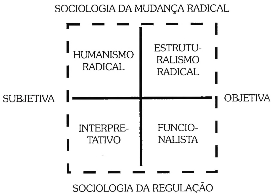
Fig. 1 - Quatro paradigmas para análise da teoria social.