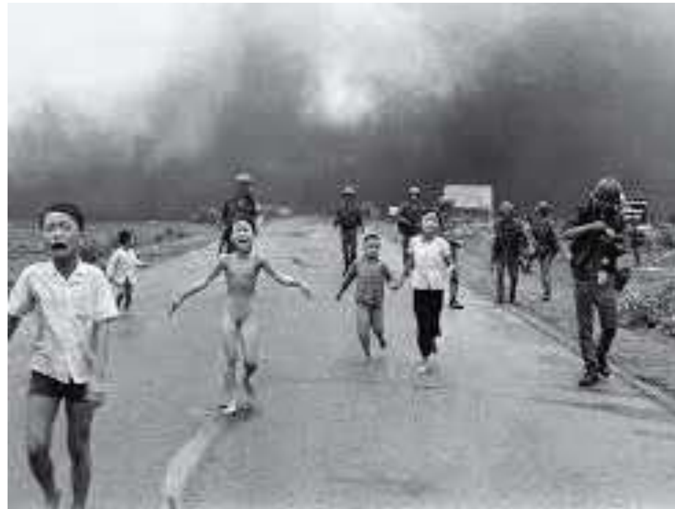
Phan Thi Kim Phuc, de nueve años (centro), al huir de su aldea en el sur de Vietnam en 1972.

Enfrentar la desinformación con Educación mediática: