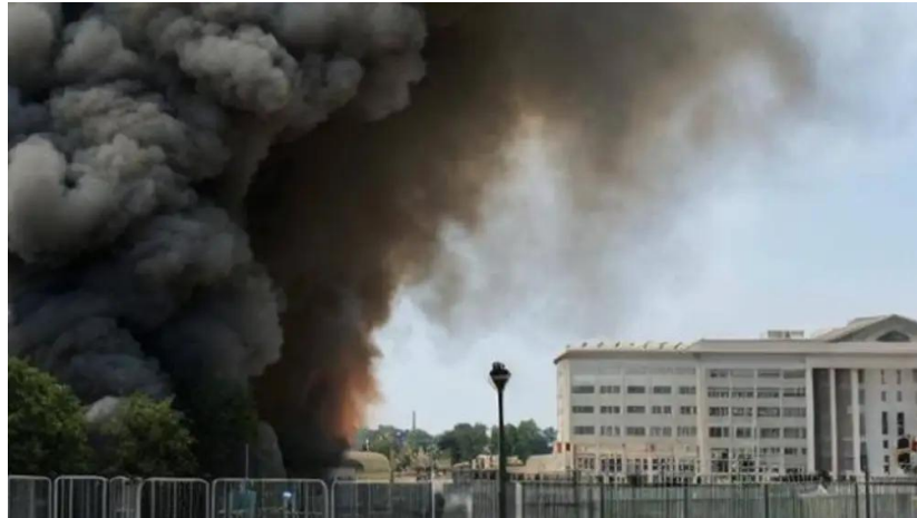
imagen creada por inteligencia artificial muestra una explosión cerca del Pentágono en WashIngton. La Razón, 23 de mayo