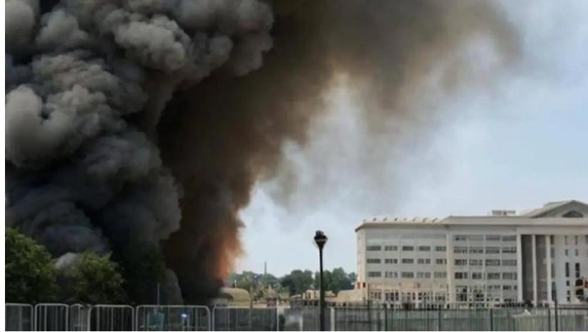
imagen creada por inteligencia artificial muestra una explosión cerca del Pentágono en WashIngton. La Razón, 23 de mayo

La desconexión de la realidad Es la desconexión con el tiempo