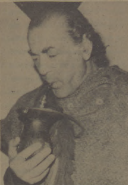
Brizola: o homem do PTB

Lula afirmou que os parlamentares presentes na sede da Federação dos Sindicatos de Bancários do Rio Grande do Sul estavam fazendo o que sempre deveriam fazer: "cumprir seu papel de representantes do povo, apoiando de todas as maneiras o movimento dos trabalhadores"